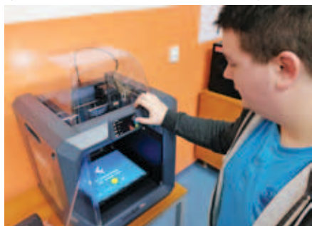
Popis fotografie: Žák třídy MS3 pracuje s 3D tiskárnou

Takto mají žáci možnost získat zkušenost s moderními technologiemi ještě předtím, než začnou sami pracovat ve firmách. Škola se tak snaží připravit je dobře na vstup do rychle se rozvíjejícího světa techniky.